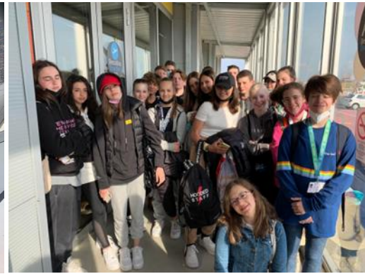
és megint hazai földön.