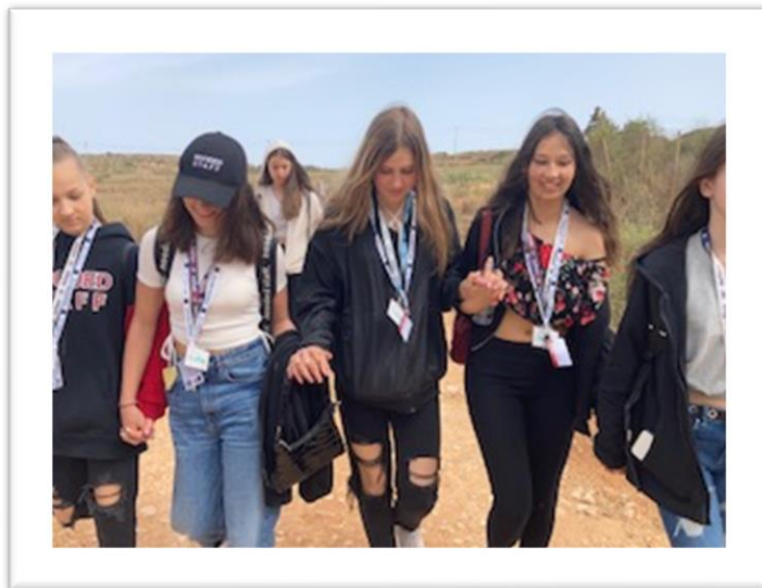
Séta a Majjstral Parkban

A máltai szigetek talán egyik legnépszerűbb strandja, a Golden Bay egy gyönyörű homokos strand. Ez Málta második legnagyobb strandja, és a nyári csúcsidezőszakban naponta turisták és helyiek százait vonzza.