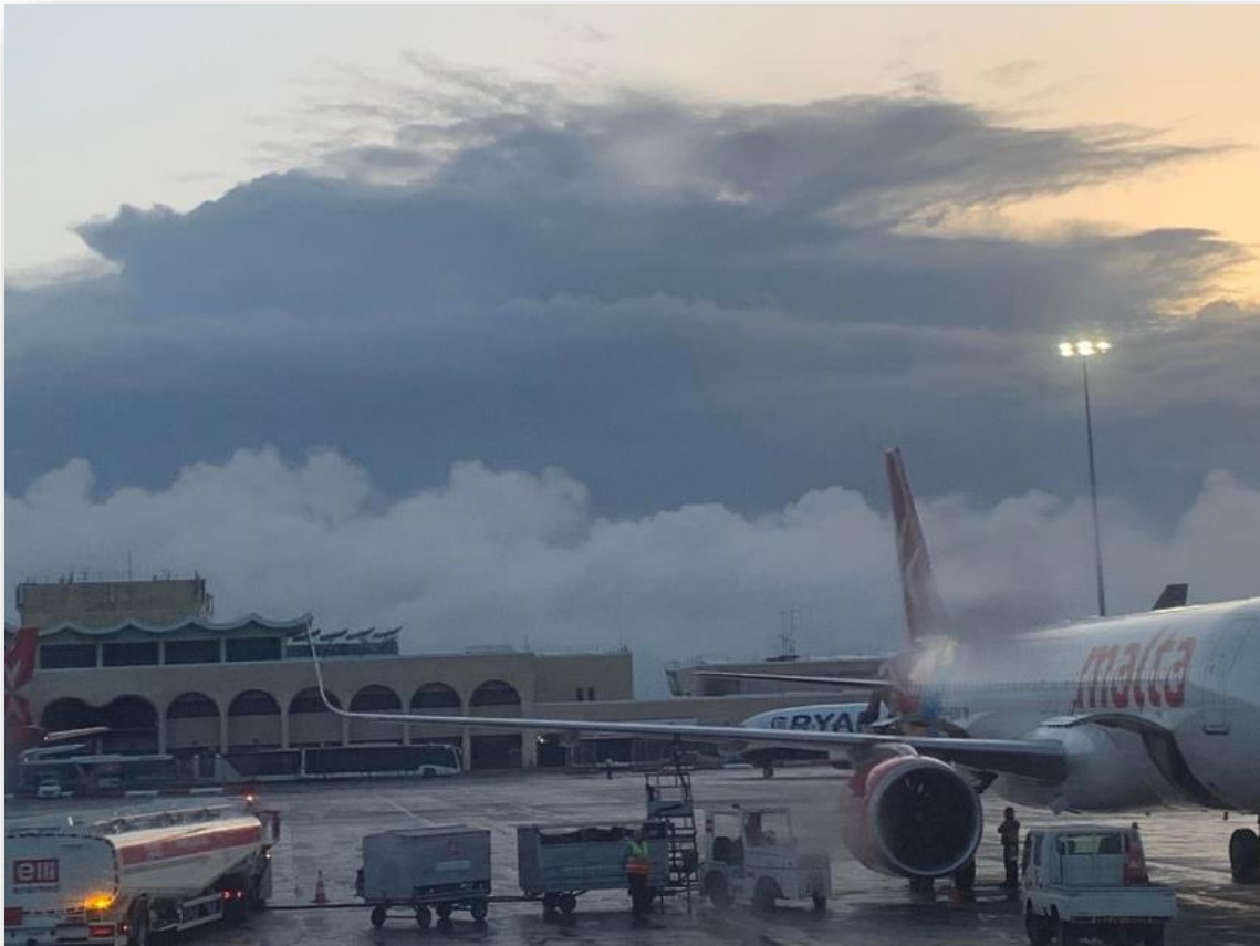
Hajnali búcsú Máltától.

Adieu, ye joys of La Valette! Adieu, sirocco, sun, and sweat!