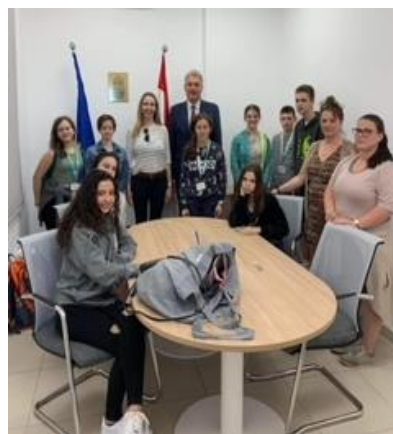
Látogatás a magyar konzulátuson.