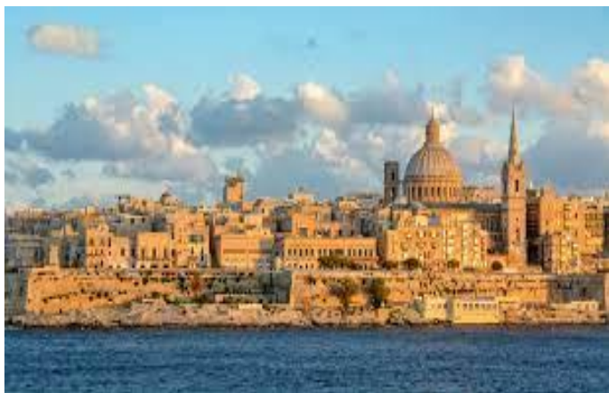
Valletta, Európa kulturális fővárosa.

Az egyik csapatot idegenvezető vitte körbe Vallettában, másik pedig szabadtéri kincsvadászaton vett részt a város történelmi utcáin, majd összefoglalót írt a látottak alapján már a GSE udvarán.