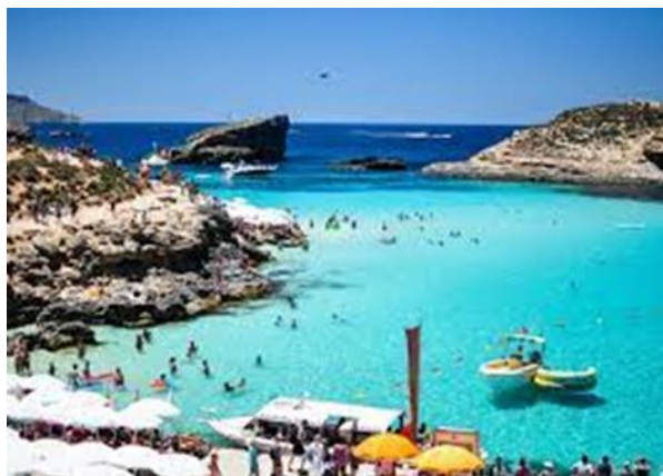
és a nagy kékség.