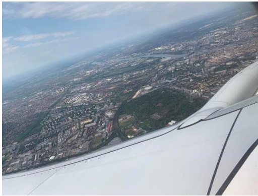
Újra Budapest felett,