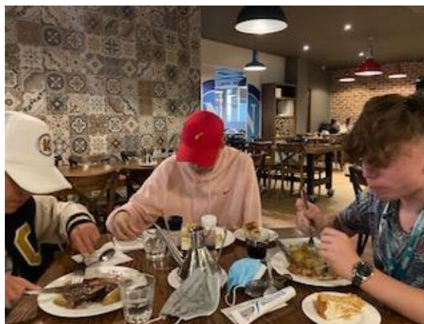
A fárasztó nap után a jól megérdemelt finom vacsora.